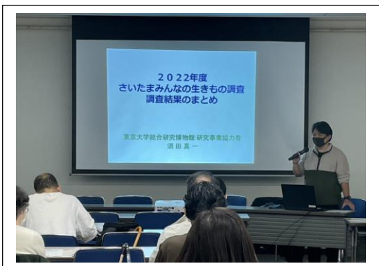
生きもの調査報告会