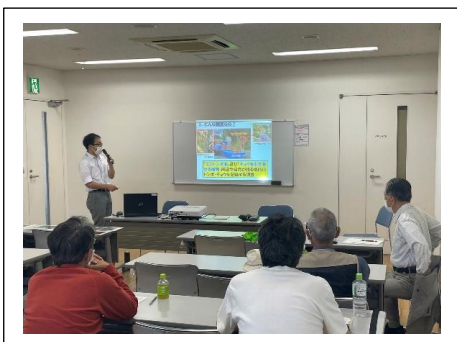
生きもの調査新規研修