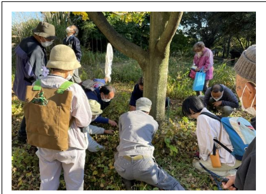
生きもの調査野外研修